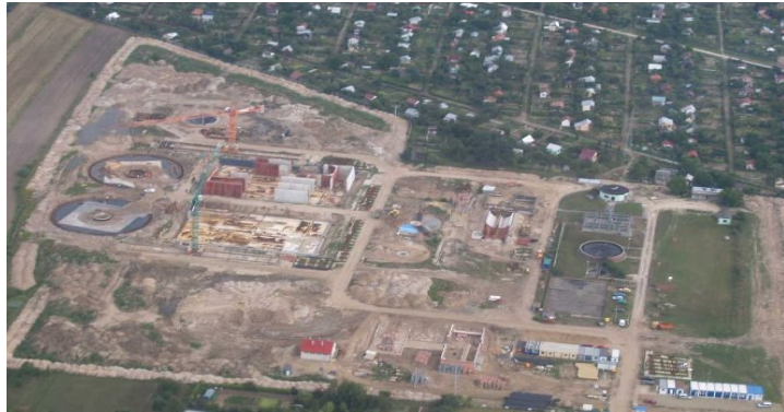
Widok na budowaną oczyszczalnię z lotu ptaka

Część ściekowa jest podzielona na dwa ciągi o wydajności 50% Q d sr każdy, mogące pracować niezależnie. W jej skład wchodzi następujące obiekty: zmodernizowana istniejąca pompownia ścieków surowych, budynek krat i separatora piasku, piaskownik napowietrzany o przepływie poziomym, pompownia