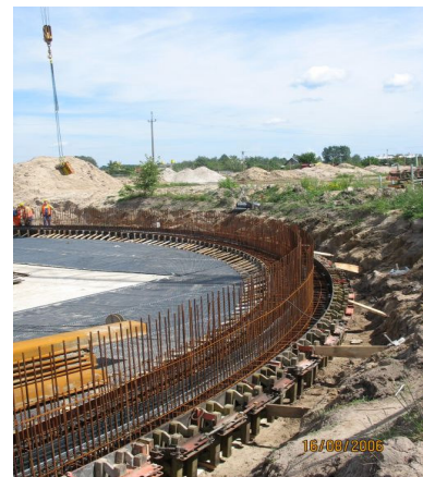
Stan budowy oczyszczalni w dniu 16.08.2006 r.

Dnia 15 września 2004 r. symbolicznie wmurowano kamień węgielny pod budowę oczyszczalni ścieków w Mielcu. Wykonawcą kontraktu była firma Skanska S.A., a planowany czas trwania jego realizacji wynosił 23 miesiące. Głównym inwestorem jest Miejskie Przedsiębiorstwo Gospodarki Komunalnej Sp. z o.o. w Mielcu. Po ukończeniu inwestycji Mielec posiadał będzie oczyszczalnię ścieków o przepustowości 14 700 m 3 /dobę. Będzie to oczyszczalnia mechaniczno-biologiczna z pogłębionym usuwaniem związków biogenych i pełnym węzłem przeróbki